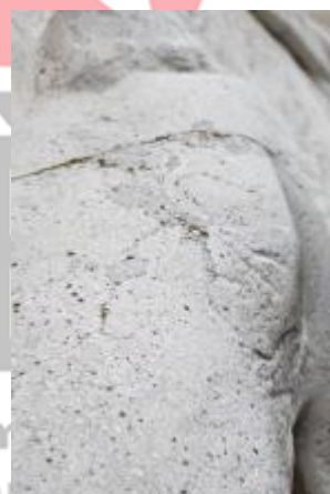
drobné poškození dívčíny postavy (3/2021, KK)