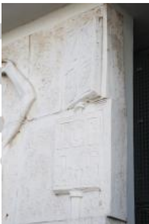
signatura (3/2021, KK)