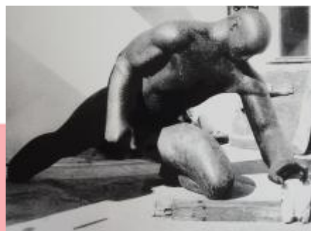
archiv Jiřího Babíčka