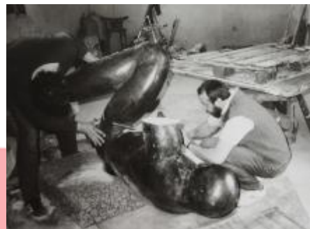
kompletace hotového díla