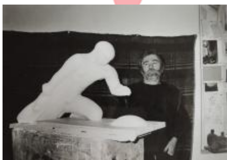
autor s modelem realizace