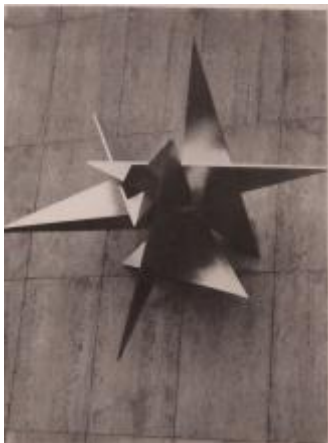
Faktografický sborník vývoje Ústředí uměleckých řemesel v letech 1952 - 1972 [obrazová část], obr. 38