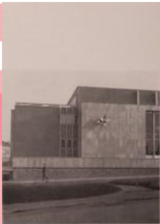
Faktografický sborník vývoje Ústředí uměleckých řemesel v letech 1952 - 1972 [obrazová část], obr. 39