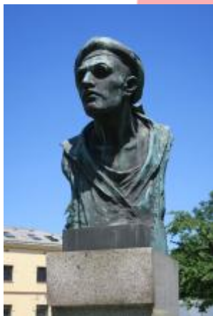
Detail - bronzová busta (06/2016/JJ)