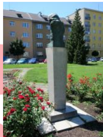
Zadní pohled (06/2016/JJ)