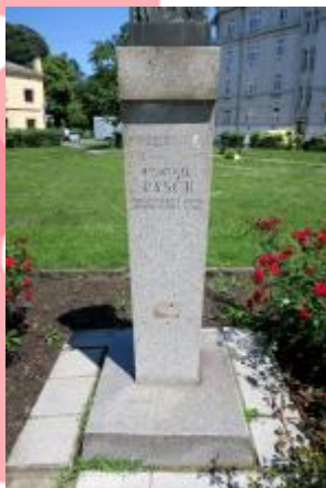
Detail - sokl (06/2016/JJ)