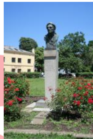
Čelní pohled (06/2016/JJ)